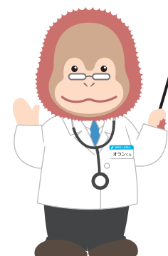
イメージキャラクター オランくん