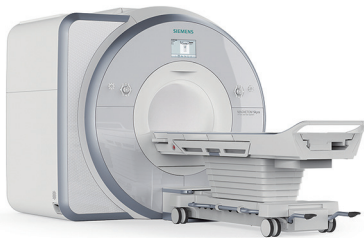
3.0T 磁共振断层摄影 MAGNETOM Skyra (SIEMENS)