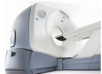
PET-CT 正电子发射计算机断层显像 Discovery ST Elite (GE)