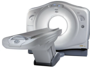
64 列宝石能谱 Discovery CT750 HD (GE)