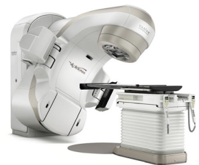
医用直线加速器 Vital Beam (Varian)

综合内科，呼吸外科，呼吸内科，心血管内科，心血管外科， 消化内科（胃肠·肝胆胰），消化内窥镜科，消化外科，糖尿病代 谢科，骨科，康复治疗科，皮肤科，整形外科，神经外科， 脊椎脊髓外科，妇科，乳腺·内分泌外科，泌尿科，肾内科， 放射线科，放射线治疗科，急诊科，麻醉科，肿瘤科，病理诊 断科，体检中心 SOPHIA