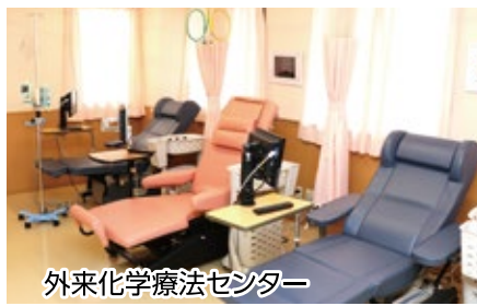
外来化学療法センター