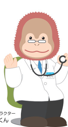
イメージキャラクター オランくん