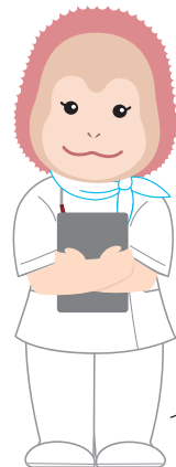
イメージキャラクター ウタンちゃん